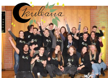
Die Berufsschüler der Stauffenbergsschule in Frankfurt

unseren Vereinszielen entspricht, freuen wir uns umso mehr über die großzügige Spende im vierstelligen Bereich von Kuleana Greenmarket. Wir sagen an dieser Stelle: vielen herzlichen Dank!!! Kuleana Greenmarket spendet 100 % der erzielten Erlöse an Tropica Verde. Dies ist ein wertvoller Beitrag für unsere Projekte in Costa Rica.