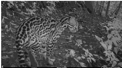
Ozelot in der Reserva Monte Alto

Von Ozelot über Ameisenbär, Pekari, Tapisquintle bis Gürteltier.